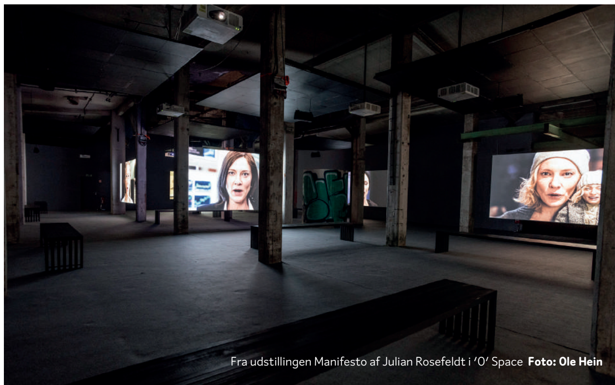
Fra udstillingen Manifesto af Julian Rosefeldt i 'O' Space

Hovedparten af 'O'Space's udstillinger er skabt specielt til Aarhus 2017 og indskrives sig tillige i Kulturhovedstadens store satsning på samtidskunsten med titlen "Coast to Coast", der præsenterer nye værker af internationale samtidskunstnere i hele Region Midtjylland. //