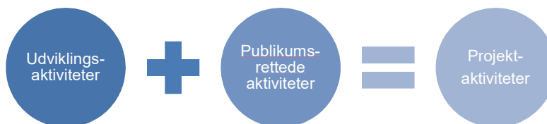
Figur 2: Kommunernes ROI

"Udviklingsaktiviteter" blev defineret som f.eks. workshops, konferencer, kompetenceudviklingsforløb mv., hvor der er deltagere . "Publikumsrettede aktiviteter" blev defineret som f.eks. koncerter, teaterforestillinger, udstillinger, shows, rundvisninger og byrumsinstallationer, hvor der er publikum .